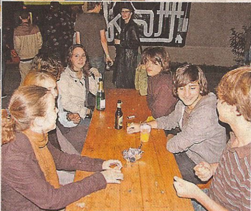
Einfallreiche Darbietungen an einem letzten lauen Sommerabend